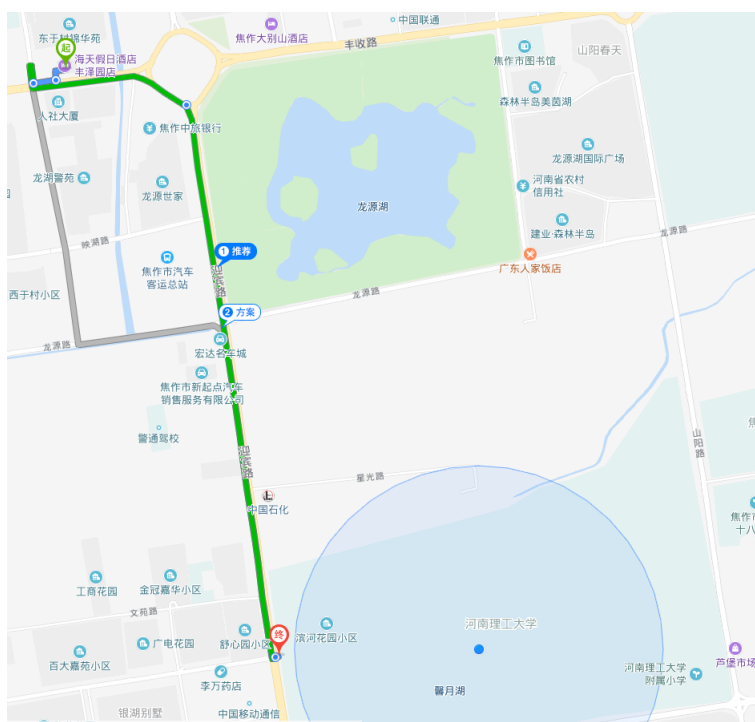
机场大巴终点站（海天假日酒店）到河南理工大学新校区路线图

到达郑州新郑国际机场后，坐机场大巴直接到达终点站（焦作市海天假日酒店，约 120km），从海天假日酒店可乘坐出租车到河南理工大学接待服务中心（约 3.5km）或焦作云达国际饭店（约 5.5km）。