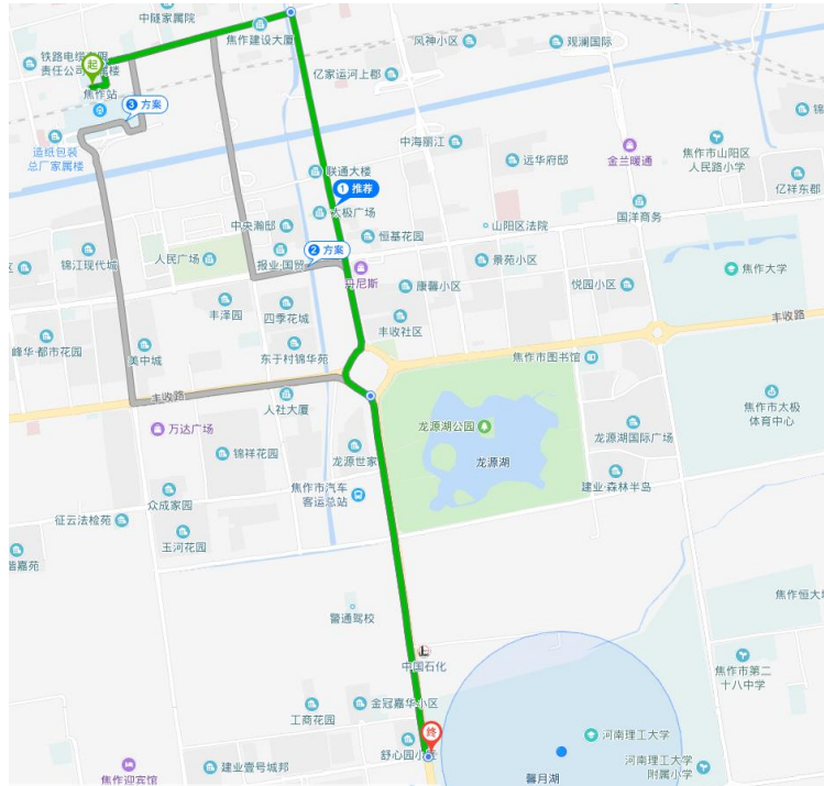
焦作火车站到河南理工大学新校区路线图

焦作火车站距离焦作云达国际饭店约 3.2km，可乘坐出租车前往，也可从南广场出站乘坐 2 路公交车到电厂五号院站下车，步行 400 米到达宾馆。