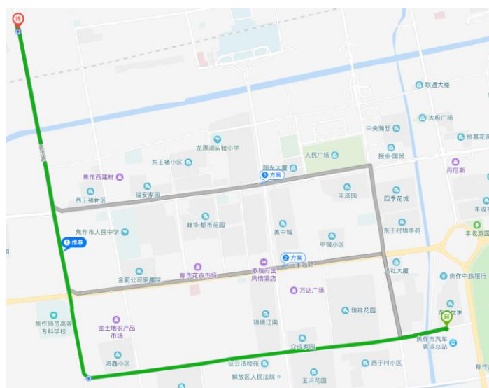
焦作汽车客运总站到焦作云达国际饭店路线图

中国地理信息产业协会教育与科普工作委员会 第七届全国大学生 GIS 应用技能大赛组委会