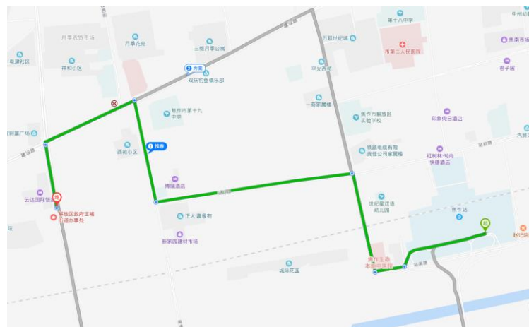
焦作火车站到云达国际饭店路线图